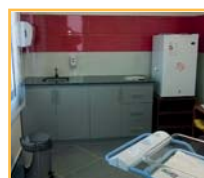
UDAI Maldonado Av. Martiniano Chiossi y Av Córdoba Maldonado