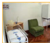
ATyR Sarandí 328 Montevideo