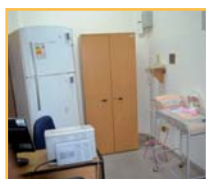
Edificio Aguada Martín García 1363 Montevideo