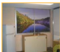
Edificio Nuevo Colonia 1921 Montevideo