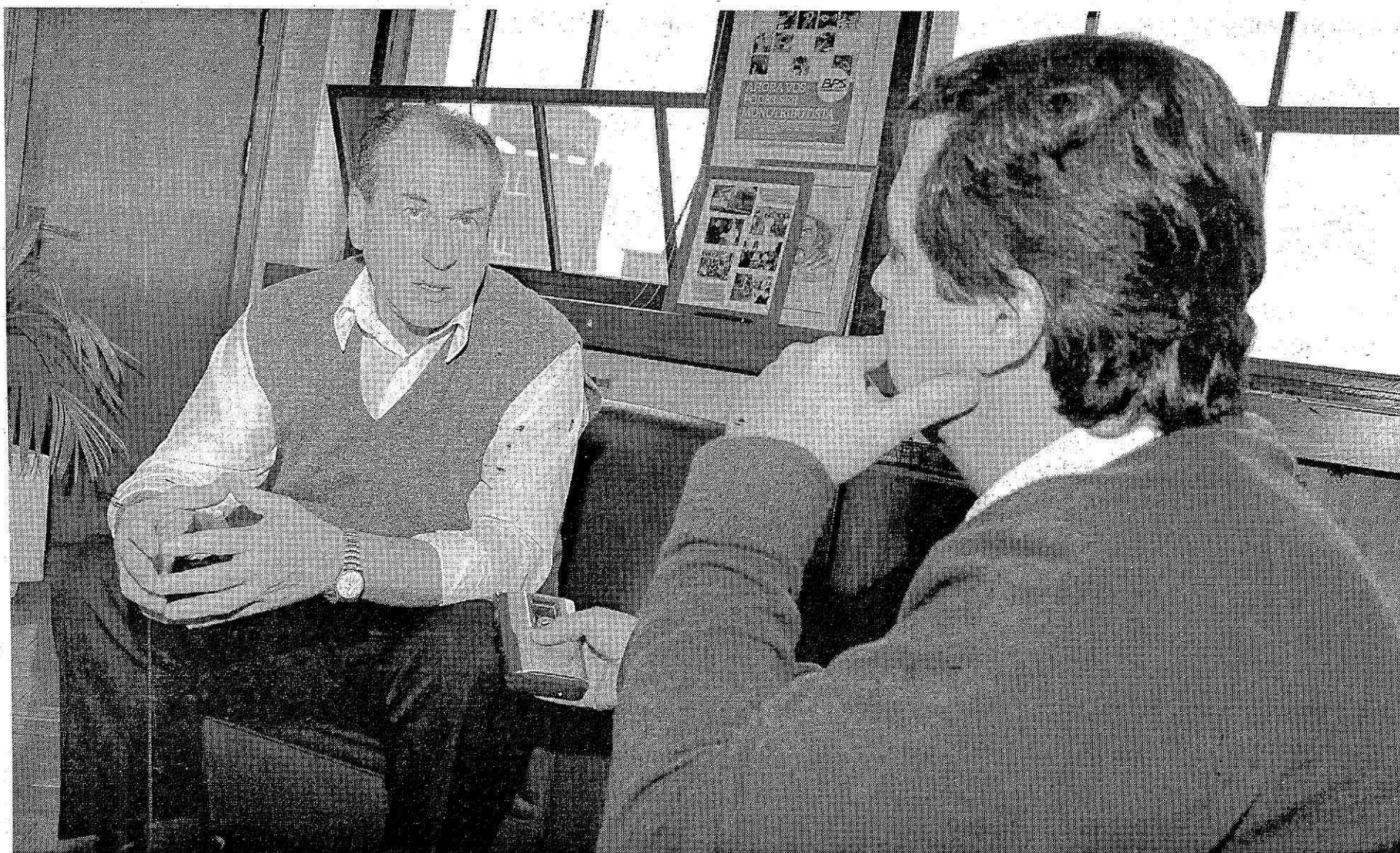
Deporte. "Hay cantidad de clubes de barrio o de poblaciones del interior que podrán ponerse al día".

hayan mejorado su jubilación. La reliquidación abarca las pasividades a partir de 1975.